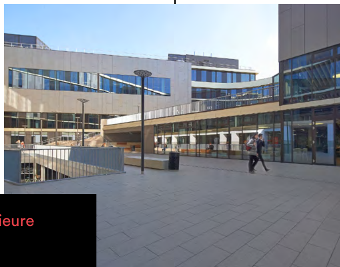
KAREL DE GROTE | Ecole supérieure Anvers

Nos environnements scolaires répondent non seulement aux besoins d'aujourd'hui, mais sont également prêts à relever les défis de demain.